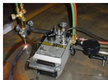
Устройство для резки кругов